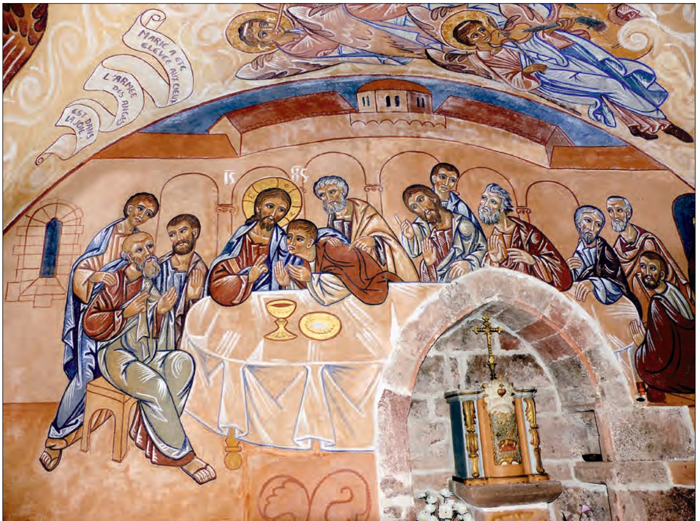
Chapelle de N.D. de la Lauzière près de Saint-Juéry-d'Aveyron (12550)